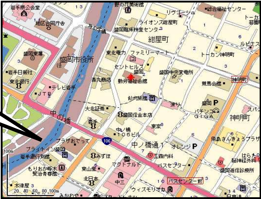
地図：マップファン